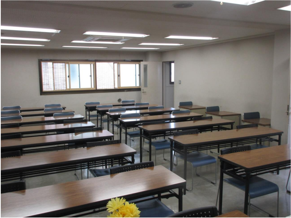
全体：間を空けて密接を防ぐ