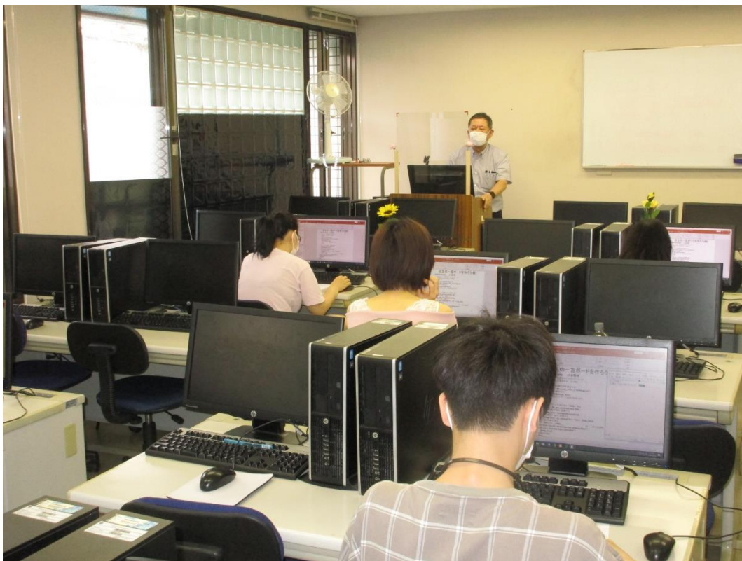
講師のPC画面を学生のPC画面に投影するソフトの活用で講師の巡回回数を削減