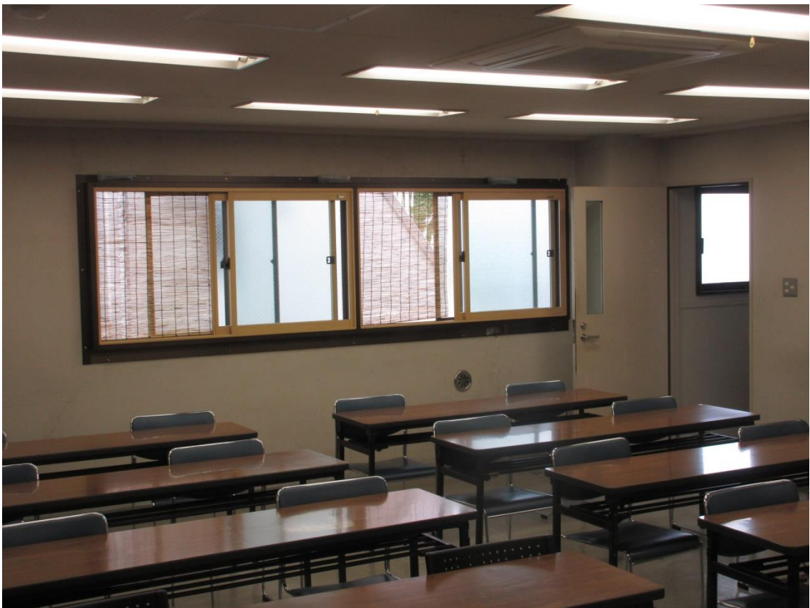
窓：開放し換気に努める