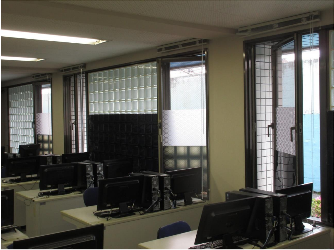
窓：開放し換気に努める