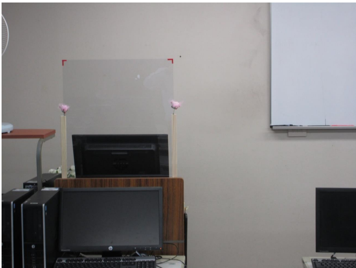
講師用デスク:飛沫を防ぐためパネル(透明アクリル板)を設置