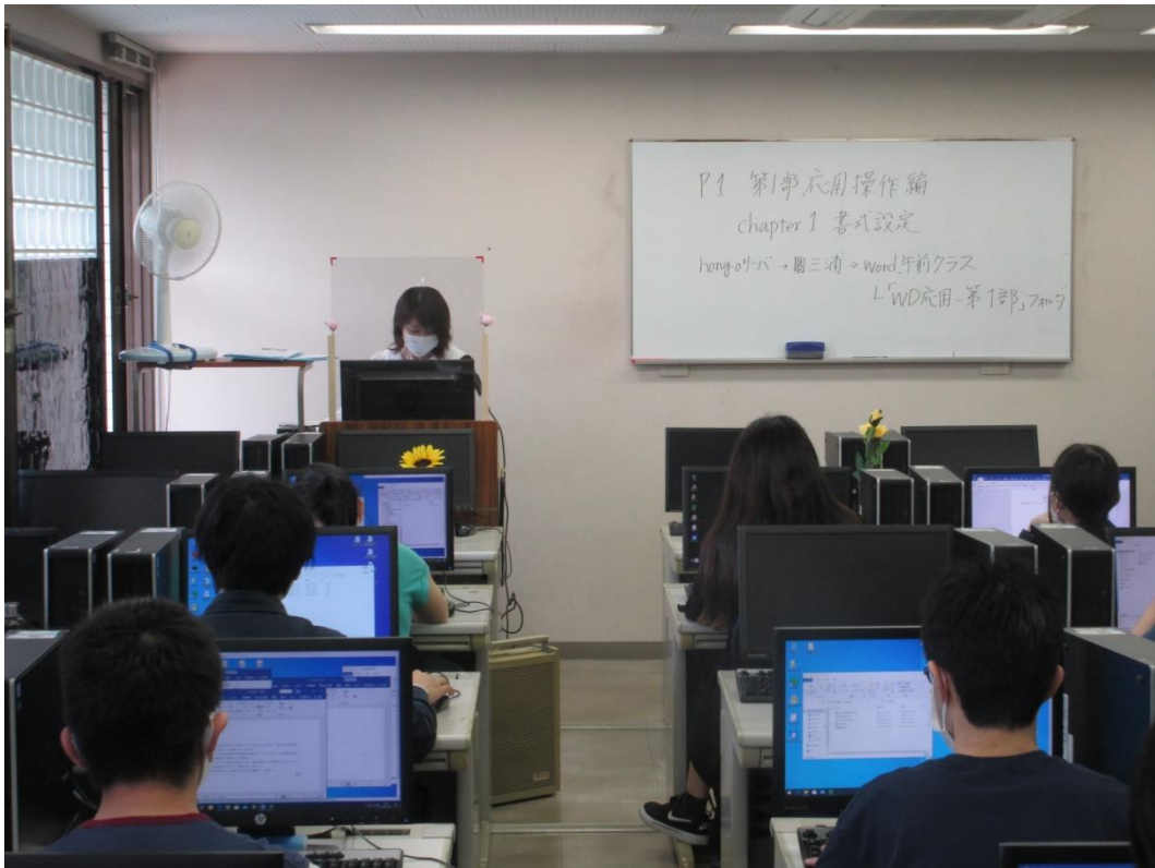
飛沫感染防止のため、講師席の前にはアクリル板を設置