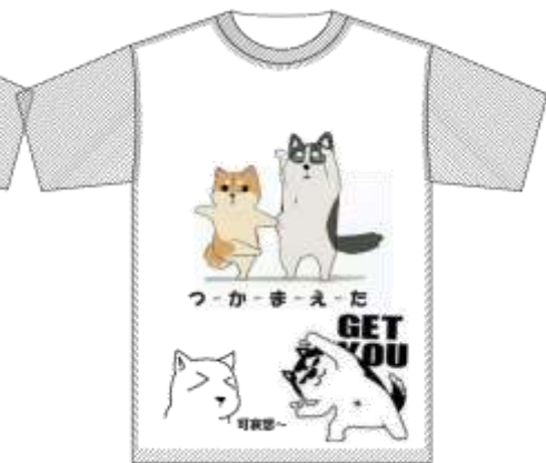
「ツカマエタ」イレイ